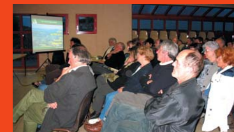
▶ Forum de Serres sur Arget

ses effets possibles sur le terrain pour le développement durable des Pyrénées Ariégeoises. Ils ont systématiquement eu lieu dans un climat convivial et constructif. De plus, aucun participant n'a manifesté ni exprimé d'opposition au projet de PNR. De nouvelles réunions peuvent avoir lieu dès cet automne, à la demande ■