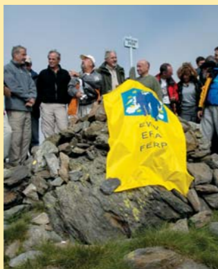
Inauguration d'un sentier transfrontalier au port de Rat 2539 m ▶

Pour y parvenir, le Syndicat Mixte de préfiguration a décidé de s'adjoindre les services de la Mission Opérationnelle Transfrontalière (MOT). Emanation de la DIACT (ex DATAR) et de la Caisse des Dépôts et Consignations, la MOT est spécialisée dans l'organisation des coopérations transfrontalières et dans l'appui aux acteurs locaux concernés. Sa contribution au projet de PNR, conduite fin 2006-début 2007, doit permettre d'aider à définir les partenaires, projets et modalités de collaboration possibles. Menée en amont de la création du PNR, dès l'élaboration de sa Charte, elle permettra de lui donner une dimension transfrontalière dès son origine et ainsi de profiter de toutes les synergies possibles ■