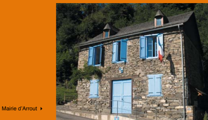
► Mairie d'Arrout

La méthode repose également sur l'implication individuelle et collective des communes concernées, retenues suite à un appel à candidatures en fin d'hiver dernier, et sur celle du Syndicat Mixte de Préfiguration du PNR. La quasi-totalité des communes de la vallée de la Barguillère ayant répondu favorablement à l'appel à candidatures, la question y est spécialement traitée sous forme d'expérimentation d'inventaire global à l'échelle de la vallée. La démarche pourrait par la suite déboucher sur la mise en place d'une charte architecturale et paysagère.