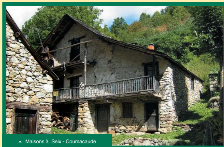
▲ Maisons à Seix - Coumacaude

Il vise à fournir des outils aux élus des communes et intercommunalités qui composent le PNR, pour répondre aux besoins et questions en matière d'architecture, de cadre de vie, d'urbanisme, de mise en valeur... Il constituera ainsi une base pour des actions telles que des Chartes architecturales, des documents et actions de sensibilisation au patrimoine bâti, des opérations de type « opérations façades »... Il pourra également être pris en compte par les communes dans l'élaboration de leurs documents d'urbanisme. Il sera enfin un outil de communication pour les communes, communautés de communes et autres, pour qui il pourra être décliné sous diverses formes selon les besoins.