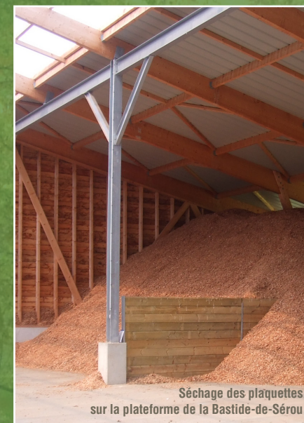
Séchage des plaquettes sur la plateforme de la Bastide-de-Sérou

La facturation est liée à la quantité d'énergie livrée. Le bon de livraison précise également : la forêt d'origine des plaquettes, les essences de bois dominantes et la plateforme d'origine.