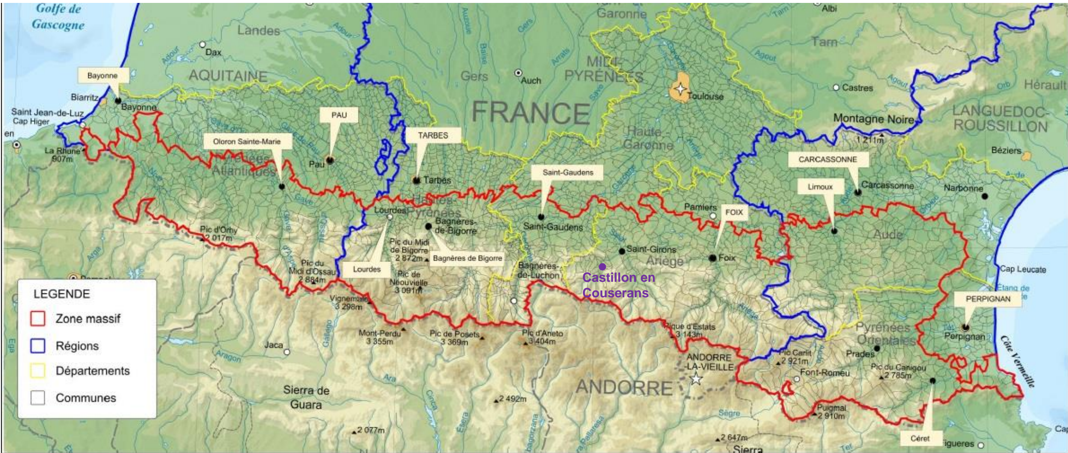
Carte du massif des Pyrénées