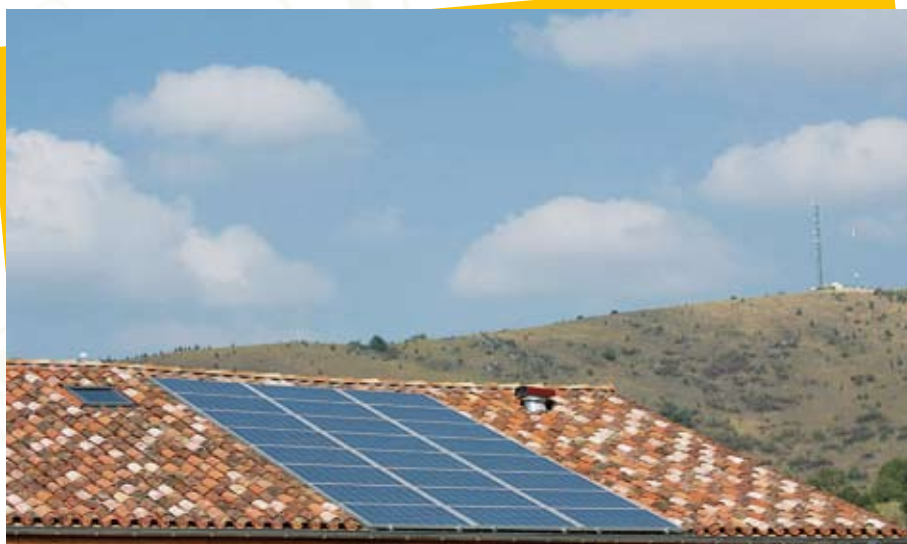
Panneaux photovoltaïques en toiture

Depuis le mois de mai 2009, le Syndicat mixte s'est engagé dans une opération régionale d'éco-responsabilité des collectivités pilotée