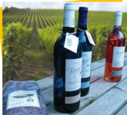
Produits marqués du PNR Camargue

Comme dans tous les Parcs, le SMPNR pourra mettre en avant des produits, savoir-faire et accueils du Parc, sous l'appellation : « Parc naturel régional des Pyrénées Ariégeoises ». Marque collective déposée à l'INPI (Institut National de la Propriété Industrielle), propriété de l'Etat via le Ministère en charge de l'Environnement, sa gestion est déléguée localement au Syndicat mixte du PNR. La « Marque Parc » est un outil de développement et de valorisation économique, social et environnemental, dont peuvent bénéficier des produits ou services situés sur le PNR, répondant à un certain nombre de critères : les produits ou prestations marqués respectent des cahiers des charges spécifiques.