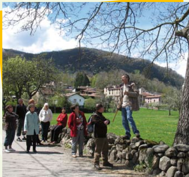
Sortie « Au fil des haies » à Prayols

Dans l'objectif d'animation et de porter à connaissance des habitants, la charte architecturale de la Barguillère, le SMPNR a organisé une animation sur les haies et les arbres le 18 avril à Prayols. L'après-midi a été animée par l'Agence des arbres : ce fut l'occasion d'insister sur l'intérêt écologique et paysager des haies champêtres, des haies libres et constituées de plusieurs essences et sur quelques trucs à savoir sur la tailles des arbres. 25 personnes ont assisté à cette animation.