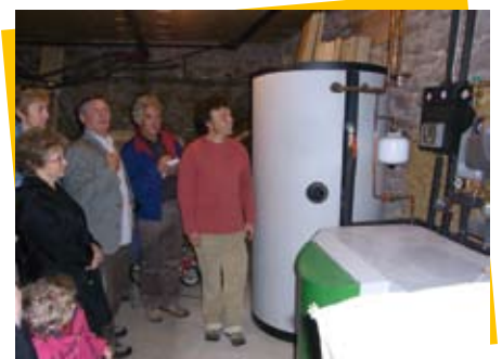
Visites chez les particuliers