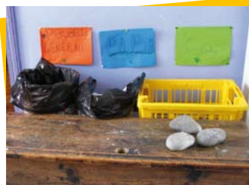
Tri sélectif à l'école de Bousсенac