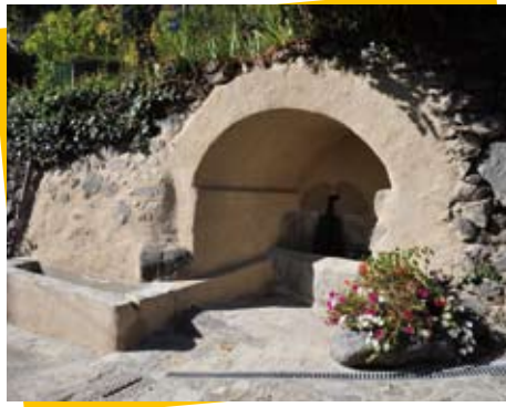
Fontaine restaurée à Illier

Dans la continuité de l'inventaire du Petit Patrimoine Bâti (PPB) réalisé sur l'ensemble du projet de PNR en 2006-2007, le Syndicat mixte a poursuivi son action pour aider les projets de restauration du petit patrimoine bâti. Il a coordonné en partenariat avec le CAUE la mise en œuvre du fonds d'aide à la réhabilitation du petit patrimoine bâti, mis en place en 2007 grâce au concours financier de la Région. Durant l'année, le Syndicat mixte s'est mobilisé pour la mise en œuvre opérationnelle de ce fonds en assurant notamment le lien entre les porteurs de projets de restauration et la Région. En plus des 20 communes ayant fait appel aux services du Syndicat mixte du PNR et du CAUE en 2008, 16 communes ont souhaité bénéficier en 2009 de ce fonds d'aide. Au total, 142 édifices ont fait l'objet de recommandations du CAUE. Le SMPNR a effectué en 2009 avec le CAUE les visites intermédiaires de chantier pour 11 communes, soit 34 édifices, et assuré les réceptions de travaux pour 12 d'entre eux situés à Montjoie en Couserans, Siguer, Illier Laramade, Gestiers, Nescus et Biert. Contact : Audrey Duraud