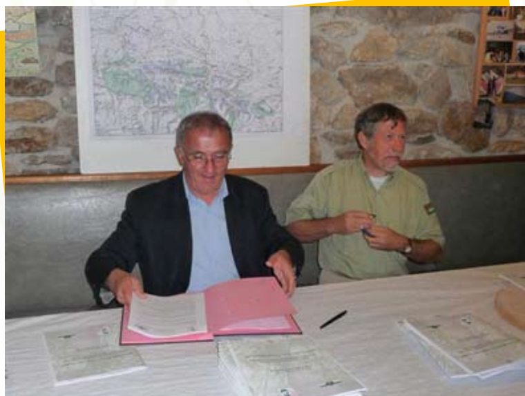
Signature de la convention avec l'ONF au Prat d'Albis