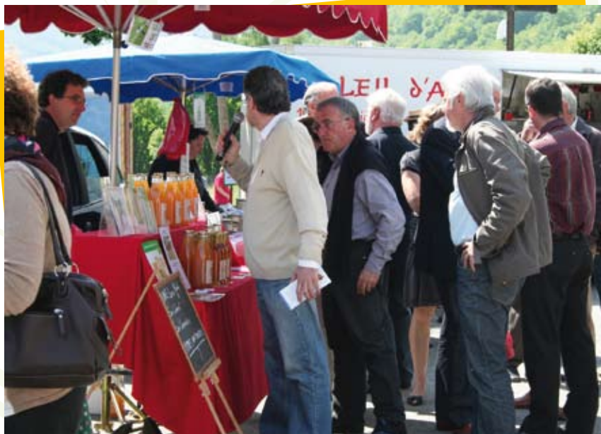
Un marché animé

Le SMPNR a ensuite accompagné la Mairie de Prayols, à l'automne 2009, dans le bilan d'étape effectué avec les commerçants exposants, sur le bon déroulement du marché. Pour pérenniser et participer à l'animation du