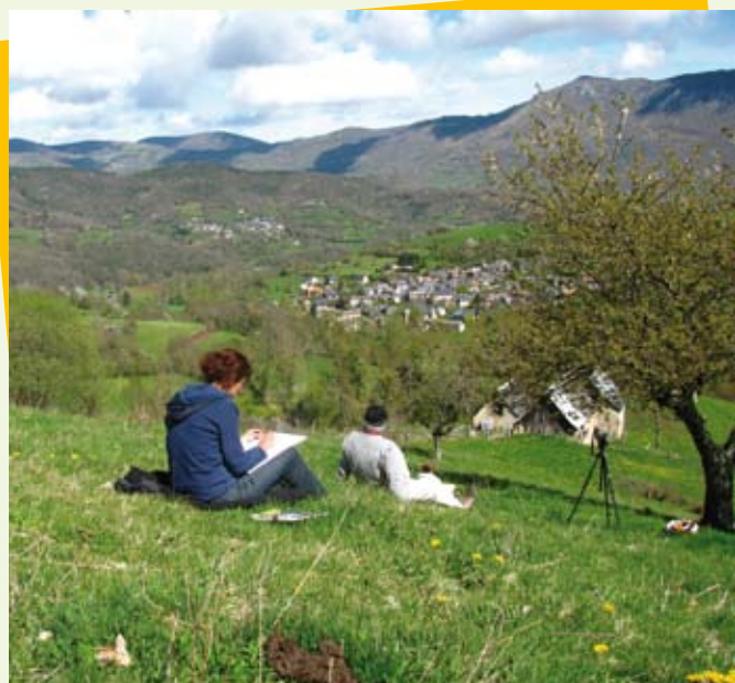
Croquis de terrain à Cescau

Le Syndicat mixte a renouvelé son engagement aux côtés du Conseil Régional pour le financement et l'organisation d'une sorties sur le terrain dans le cadre des Journées Nature de Midi-Pyrénées. La commune de Siguer, le Centre de Formation à la Randonnée de Goulier et le Comité départemental de la Randonnée Pédestre de l'Ariège ont accueilli un public familial d'une cinquantaine de personnes habitants d'Empalot à Toulouse pour deux randonnées découverte du patrimoine naturel de Siguer.