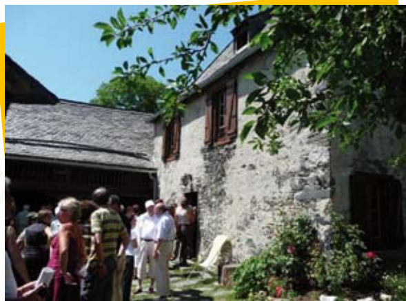
Inauguration à St-Jean-du-Castillonnais