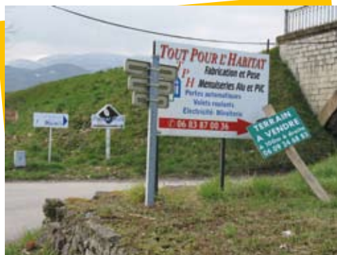
Publicités à l'entrée de St-Girons