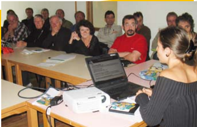
Réunion de commission