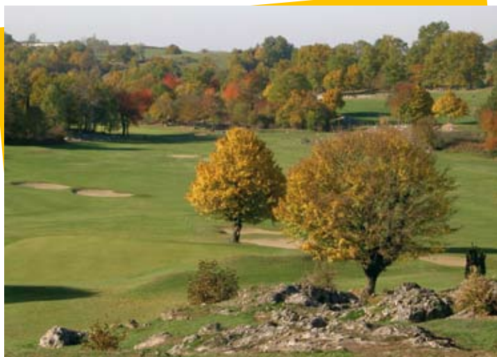
Le golf de l'Ariège