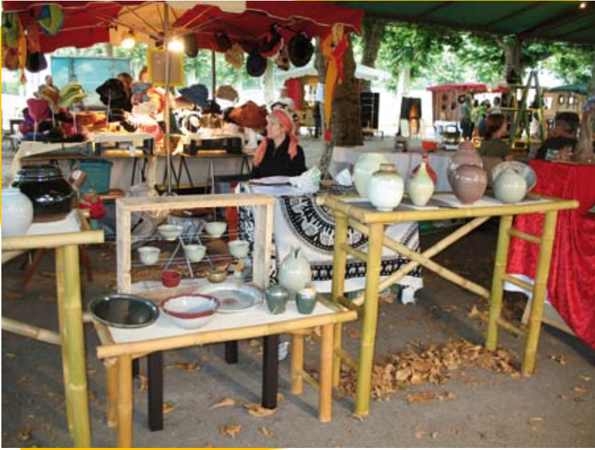
Les artisans d'art s'exposent

Le SMPNR a accompagné et soutenu l'association Héliciel, association de promotion et de diffusion du travail des artisans d'art d'Ariège, notamment dans l'organisation du second Festival des Métiers d'Art, les 17 et 18 octobre à Saint-Lizier. Ce travail participe à la structuration des professionnels des métiers d'art des Pyrénées Ariégeoises, et à la valorisation et la diffusion de leur activité. Le festival a ainsi pu bénéficier d'une page de communication dans le programme « Pyrénées Partagées 2009 ». Le SMPNR a ensuite apporté un appui logistique et promotionnel à la manifestation. Il a également contribué à l'organisation de conférences destinées aux professionnels (retour d'expérience d'un autre territoire sur le développement des métiers d'art) et au grand public (débat autour de la place de l'art dans le développement personnel). La tenue de ces conférences a ainsi permis d'ouvrir de nouvelles perspectives pour le développement des métiers d'art. Pour 2010, le Festival des Métiers d'Art sera réorganisé pour la 3 ème année et le SMPNR suivra les projets de développement autour des métiers d'art sur les Pyrénées Ariégeoises.