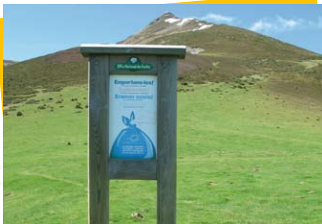
Montagne propre au col de l'Herbe Soulette