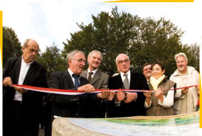
Inauguration du PNR au col de Péguère