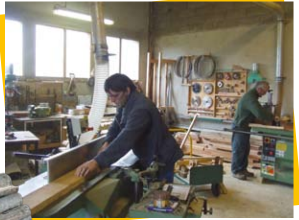
Atelier de menuiserie à Alzen

locaux, de contacter les petits propriétaires forestiers, de diagnostiquer leurs parcelles et de réaliser des travaux d'amélioration des boisements. Contact : Elodie Roulier