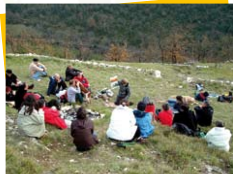
Les Amis du Parc au Mas-d'Azil