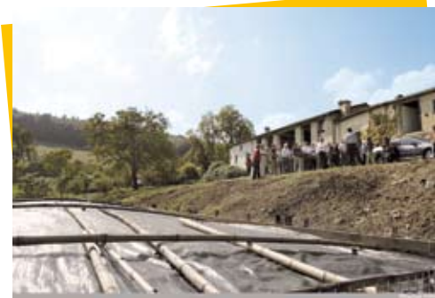
Fromagerie du Col del Fach