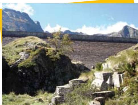
Barrage de l'étang d'Araing