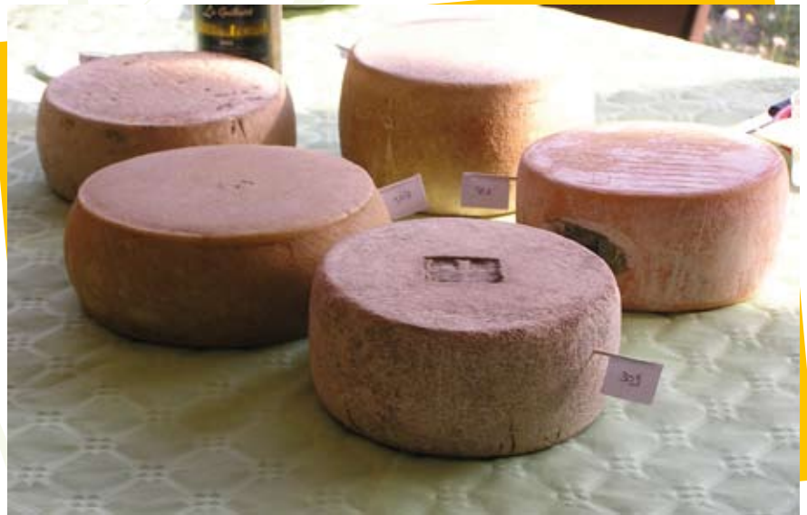
Tommes au lait cru à déguster chez les producteurs