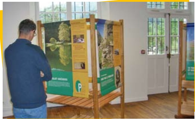
Le stand expo du PNR