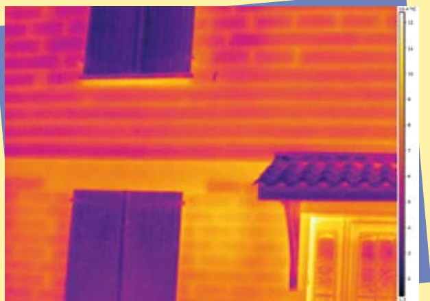
Photo d'une façade prise avec une caméra thermique

Les premières nuits de la thermographie ont été lancées le 15 décembre à Taurignan-Vieux : le conseiller Info Energie de l'ALE-DA équipé d'une caméra infrarouge, nous a fait découvrir les déperditions énergétiques des maisons en prenant des photos des façades dans les rues de la commune. Il a également donné des conseils pour réaliser des économies d'énergie. 4 autres soirées auront lieu en 2012.