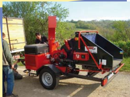
Le broyeur sur la voie verte