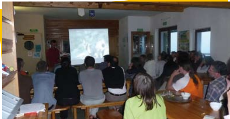
Les Rendez-vous des cimes, dans les refuges