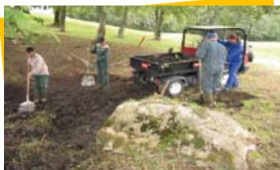
Restauration de la mare du golf

Contacts : Matthieu Cruège, Sophie Séjalon