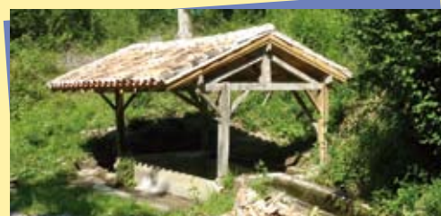
Lavoir de Betchat après travaux