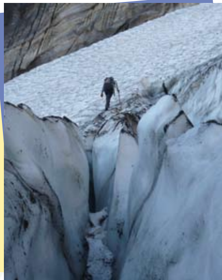
Le glacier d'Arcouzan