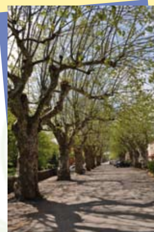
Allée de platanes