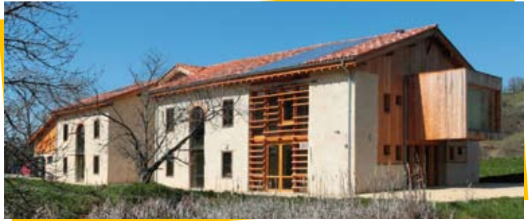
La Ferme d'Icart