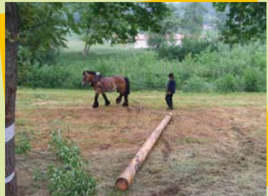
Débardage à cheval