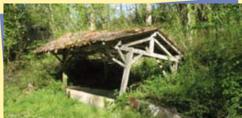
Lavoir de Betchat avant travaux