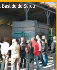
Bastide de Sérou