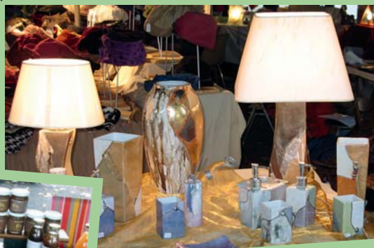
Festival des métiers d'art