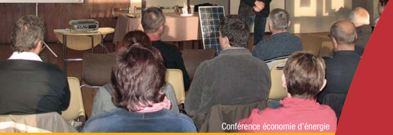
Conférence économie d'énergie