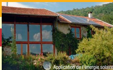
Application de l'énergie solaire