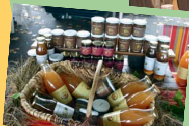
Fabriqué près de chez vous