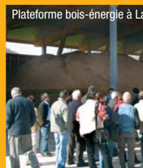
Plateforme bois-énergie à La Bastide de Sérou