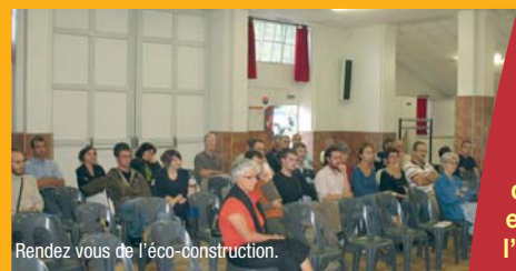
Rendez vous de l'éco-construction.