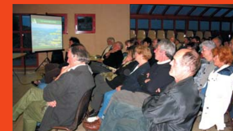
▶ Forum de Serres sur Arget

ses effets possibles sur le terrain pour le développement durable des Pyrénées Ariégeoises. Ils ont systématiquement eu lieu dans un climat convivial et constructif. De plus, aucun participant n'a manifesté ni exprimé d'opposition au projet de PNR. De nouvelles réunions peuvent avoir lieu dès cet automne, à la demande ■