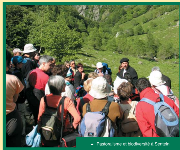
▶ Pastoralisme et biodiversité à Sentein

Début juin, la participation du projet PNR aux Journées Nature du Conseil régional, autour du pastoralisme à Sentein et de la randonnée-découverte à Brassac a permis de mobiliser plusieurs centaines de personnes autour des patrimoines, savoir-faire et acteurs de la montagne. Ce type d'action sera reconduit et même développé dès 2007 ■