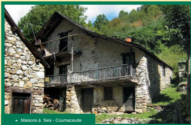
▲ Maisons à Seix - Coumacaude

Il vise à fournir des outils aux élus des communes et intercommunalités qui composent le PNR, pour répondre aux besoins et questions en matière d'architecture, de cadre de vie, d'urbanisme, de mise en valeur... Il constituera ainsi une base pour des actions telles que des Chartes architecturales, des documents et actions de sensibilisation au patrimoine bâti, des opérations de type « opérations façades »... Il pourra également être pris en compte par les communes dans l'élaboration de leurs documents d'urbanisme. Il sera enfin un outil de communication pour les communes, communautés de communes et autres, pour qui il pourra être décliné sous diverses formes selon les besoins.