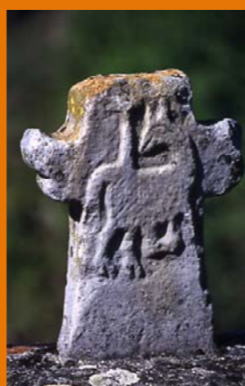
Croix à Audressein ▶

Le « petit patrimoine » aussi ... Cet été une stagiaire partagée entre le CAUE et le projet de PNR a spécifiquement travaillé sur l'inventaire du « petit patrimoine » de l'ensemble des communes du périmètre d'étude. L'objectif est de dresser un programme de restauration et de valorisation.