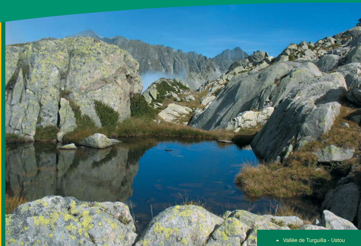
▶ Vallée de Turguilla - Ustou

Sommaire : ■ Un cycle de forums réussi ■ Inventaire territorial du patrimoine bâti : premiers résultats ■ Charte-agenda 21 : point d'étape ■ Une mission pour le transfrontalier ■ Retour sur événements.