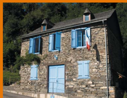
Mairie d'Arrout ▶

La méthode repose également sur l'implication individuelle et collective des communes concernées, retenues suite à un appel à candidatures en fin d'hiver dernier, et sur celle du Syndicat Mixte de Préfiguration du PNR. La quasi-totalité des communes de la vallée de la Barguillère ayant répondu favorablement à l'appel à candidatures, la question y est spécialement traitée sous forme d'expérimentation d'inventaire global à l'échelle de la vallée. La démarche pourrait par la suite déboucher sur la mise en place d'une charte architecturale et paysagère.