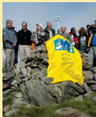
Inauguration d'un sentier transfrontalier au port de Rat 2539 m ▶

Pour y parvenir, le Syndicat Mixte de préfiguration a décidé de s'adjoindre les services de la Mission Opérationnelle Transfrontalière (MOT). Emanation de la DIACT (ex DATAR) et de la Caisse des Dépôts et Consignations, la MOT est spécialisée dans l'organisation des coopérations transfrontalières et dans l'appui aux acteurs locaux concernés. Sa contribution au projet de PNR, conduite fin 2006-début 2007, doit permettre d'aider à définir les partenaires, projets et modalités de collaboration possibles. Menée en amont de la création du PNR, dès l'élaboration de sa Charte, elle permettra de lui donner une dimension transfrontalière dès son origine et ainsi de profiter de toutes les synergies possibles ■