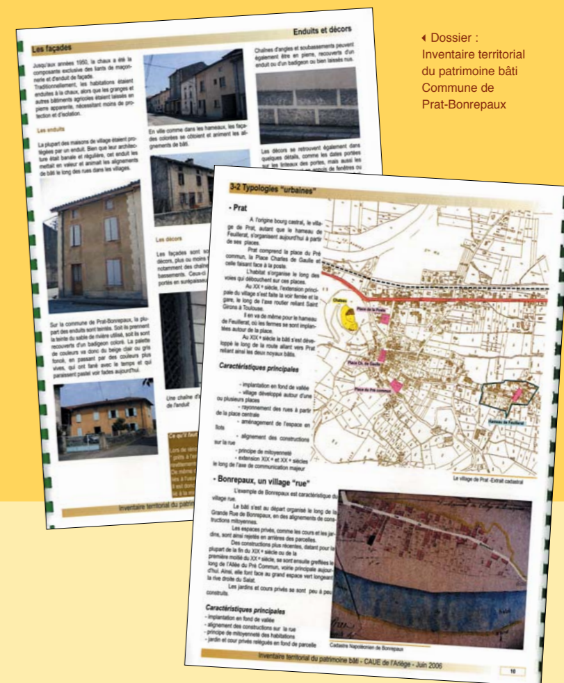
◀ Dossier : Inventaire territorial du patrimoine bâti Commune de Prat-Bonrepaux

● Les descriptions sont assorties de propositions et de préconisations, dont pourront se saisir les communes, les habitants et les professionnels du bâtiment : maîtrise et orientation du développement urbain (propositions de zonage...), traitement et valorisation des entrées de bourgs et des espaces publics, interventions de conservation et de valorisation des édifices publics et du petit patrimoine, préconisations architecturales : maintien des volets bois, mise en oeuvre d'enduits traditionnels, choix de matériaux adaptés au bâti et à son environnement, conservation des traits liés à la typologie du bâtiment... autant de références qui pourront guider utilement les choix d'aménagement.