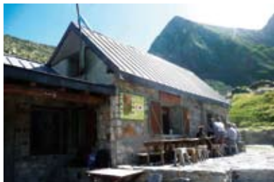
Le refuge des Estagnous

Le mont Valier est un vecteur important du tourisme en Couserans, en particulier pour les randonneurs et les passionnés de nature : ce sommet emblématique aux formes élégantes se voit de très loin, et domine un territoire à la fois accessible et très sauvage, avec une flore et une faune préservées, gages d'une authenticité de plus en plus recherchée. La maison du Valier, installée au fond de la vallée du Ribérot, complète les hébergements des randonneurs, permettant une itinérance de plusieurs jours : à l'est le gîte d'Esbintz, à l'ouest le gîte d'Eylie puis le refuge de l'étang d'Araing, et, sur le chemin d'accès au mont Valier, le refuge des Estagnous. Les dénivellations sont plutôt fortes et les étapes longues pour atteindre le sommet, par la vallée du Ribérot ou par d'autres voies, mais les amateurs trouvent sur ces sentiers des paysages et lumières uniques, ou encore le souvenir des passages clandestins de la Seconde Guerre mondiale.