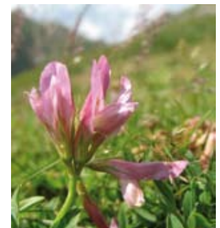
Le Trèfle des Alpes appelé aussi Réglisse