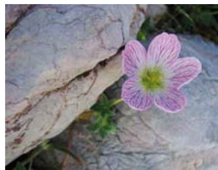
Sur les éboulis calcaires, le Geranium cendré , plante protégée