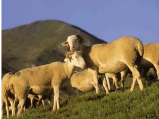
Pastoralisme sur le Valier

Au total, plus de 6000 brebis, 300 vaches et quelques chevaux appartenant à une cinquantaine d'éleveurs, estivent sur près de 6000 hectares de surfaces pastorales.