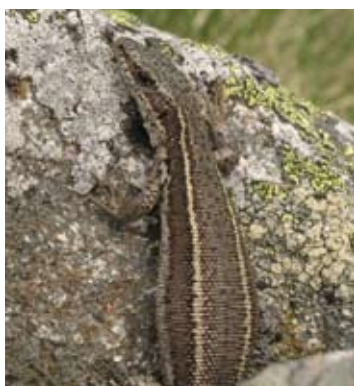
Lézard du Val d'Aran