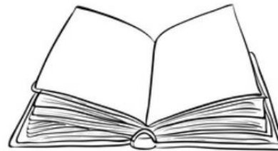
Le projet de charte