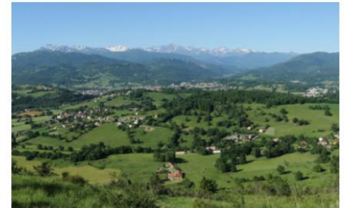
Les études préalables