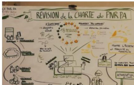
Les étapes et le périmètre d'étude

Contactez-nous sur charte@parc-pyrenees-ariegeoises.fr