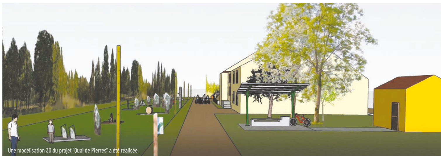
Une modélisation 3D du projet "Quai de Pierres" a été réalisée.